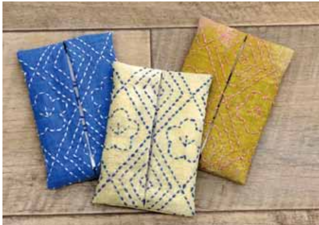
出来上がりサイズ：13cm×9cm