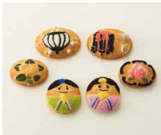
デザイン / Zoe