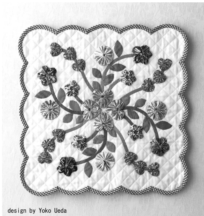
design by Yoko Ueda