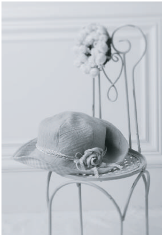
※コサージュの作り方は、別紙「リネンのバラコサージュ」をご覧ください。