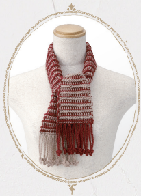
Basic Muffler 平編みで編む ミニマフラー Design / Reiko Hyakutake

2本の糸で可愛い編み地ができるダブルフックアフガン針。3つの技法にチャレンジしてください。